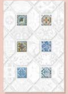
Gonzola Grey (D) ក្រចករ៉ា ក្រហម (D)