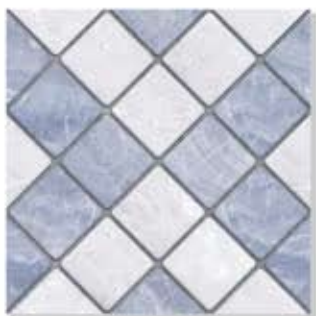
Nevada Blue ແວດາດ້າ ບຸລຸ