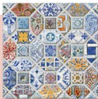
Toma Blue ໄກ່ນ້າ ບຸລຸ