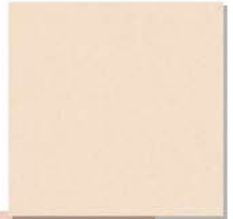
Pomelo Beige ក្រចក ខ្មៅ