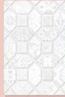
Gonzo Grey (D) ក្រចក ក្រហម (D)