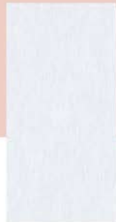
Hiro Grey (D) ອີຮ໌ ເກຣຍ໌ (D)