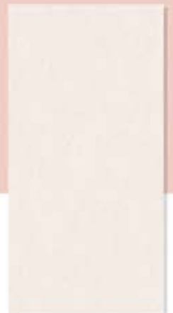
Hiro Beige (D) ອີຮ໌ ເບຈ໌ (D)