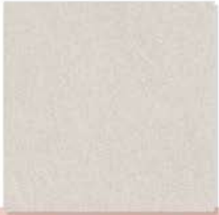
Pomelo Olive ក្រចក ខ្មៅ