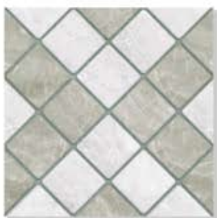
Nevada Green ແວດາດ້າ ຄຽນ