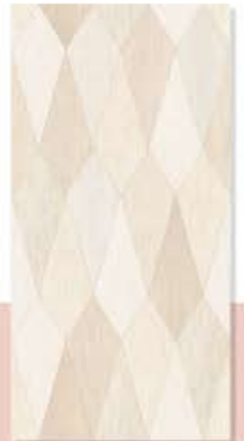
Hikaru Beige (D) ອີກະຮຸ ເບຈ໌ (D)