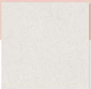
Pomelo Grey ក្រចក ក្រហម