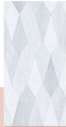
Hikaru Grey (D) ອີກະຮຸ ເກຣຍ໌ (D)