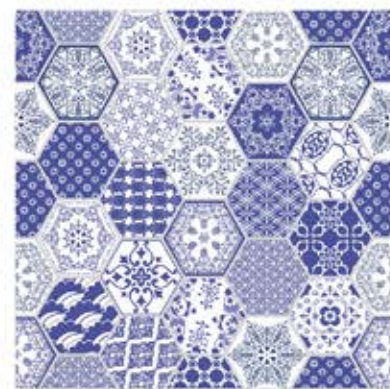
Luciana Blue ลูเซียน่า บลู