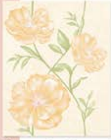
Chatsuda Orange ຈັດຮສຸດາສົມ