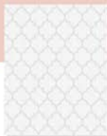
Sosa Grey ໄຍ່ນ້າ ແຄຣຍ໌