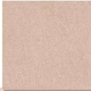
Pomelo Brown ក្រចក ប្រផេះ