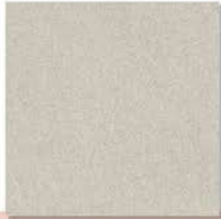
Pomelo Dark Grey ក្រចក ក្រហម