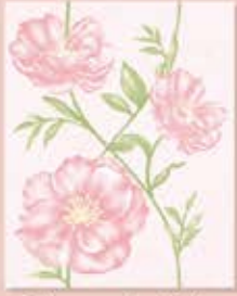
Chatsuda Pink ຈັດຮສຸດາຮມພູ