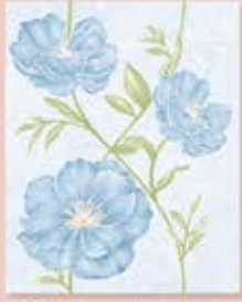
Chatsuda Blue ຈັດຮສຸດາຟ້າ