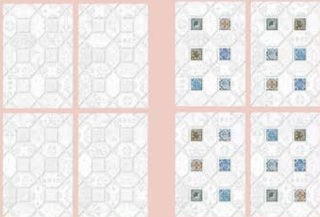
4 Random Designs